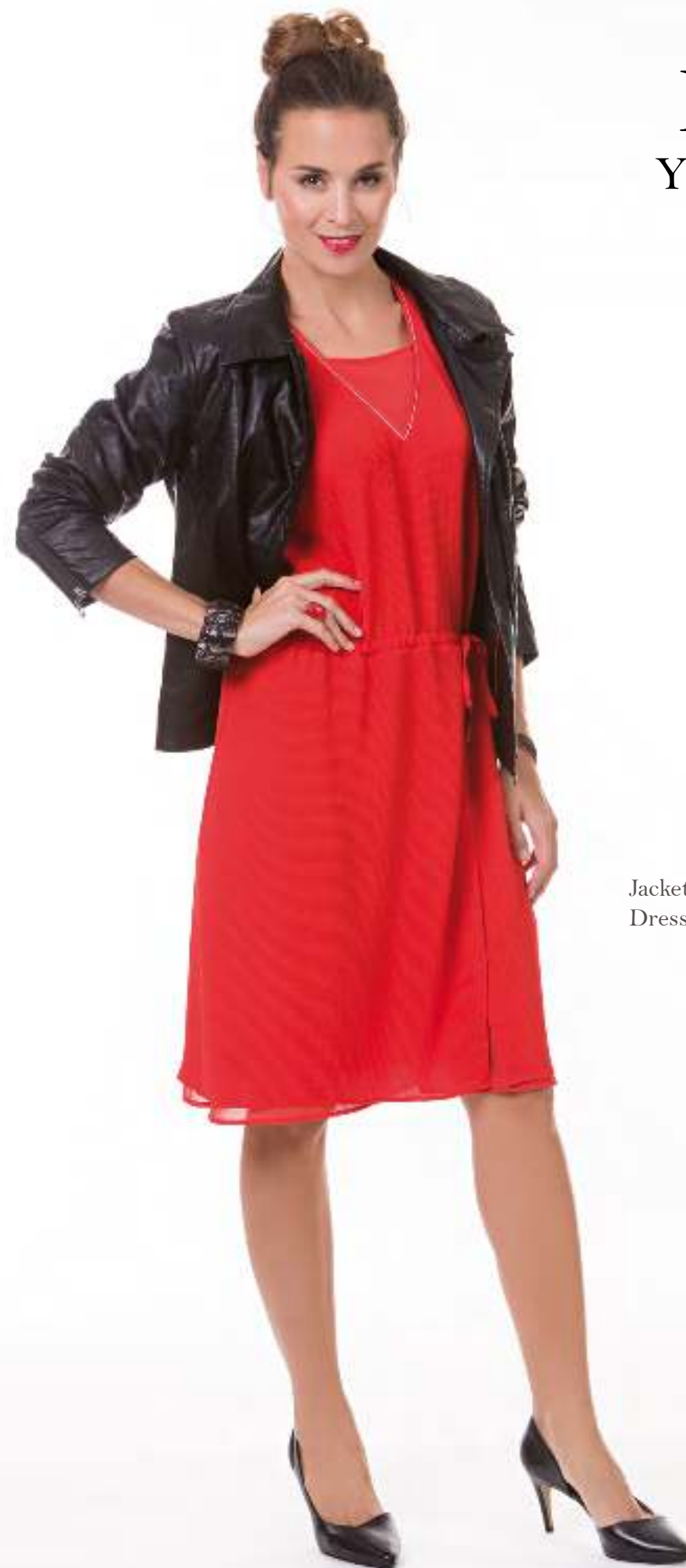
Jacket + Giveaway 140036 Dress 140603