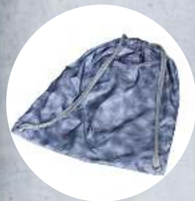
Packable bag for hood & sleeve