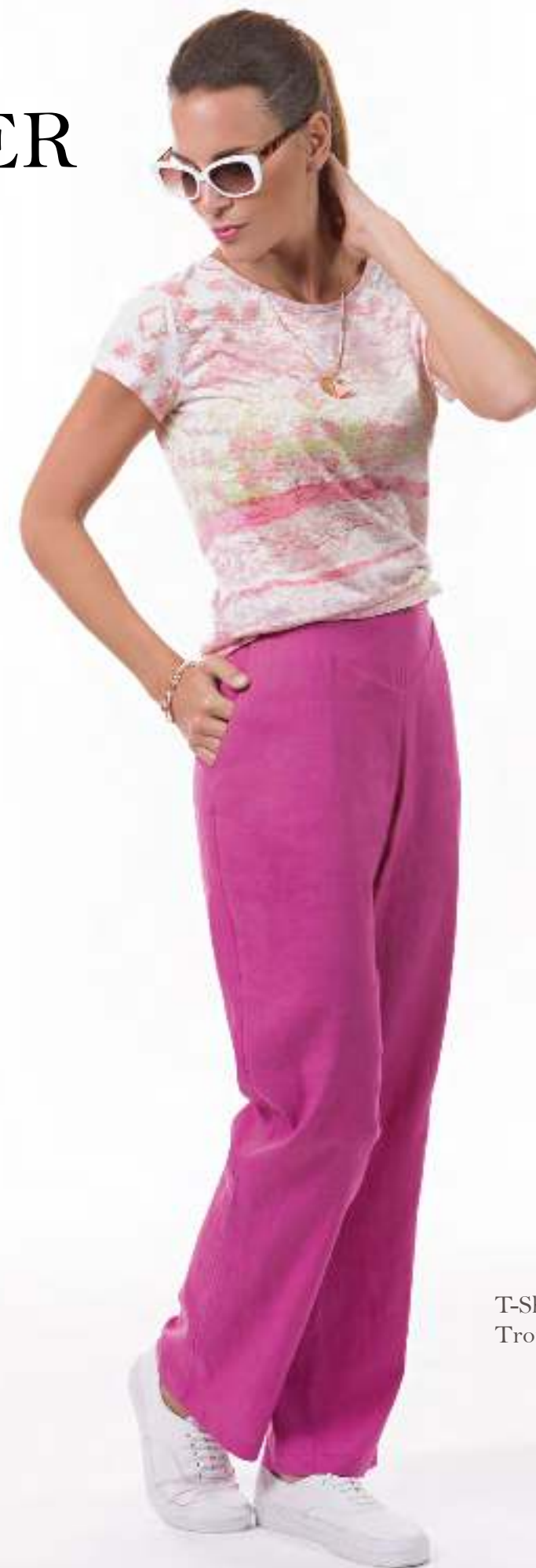
T-Shirt 140428 Trousers 140500