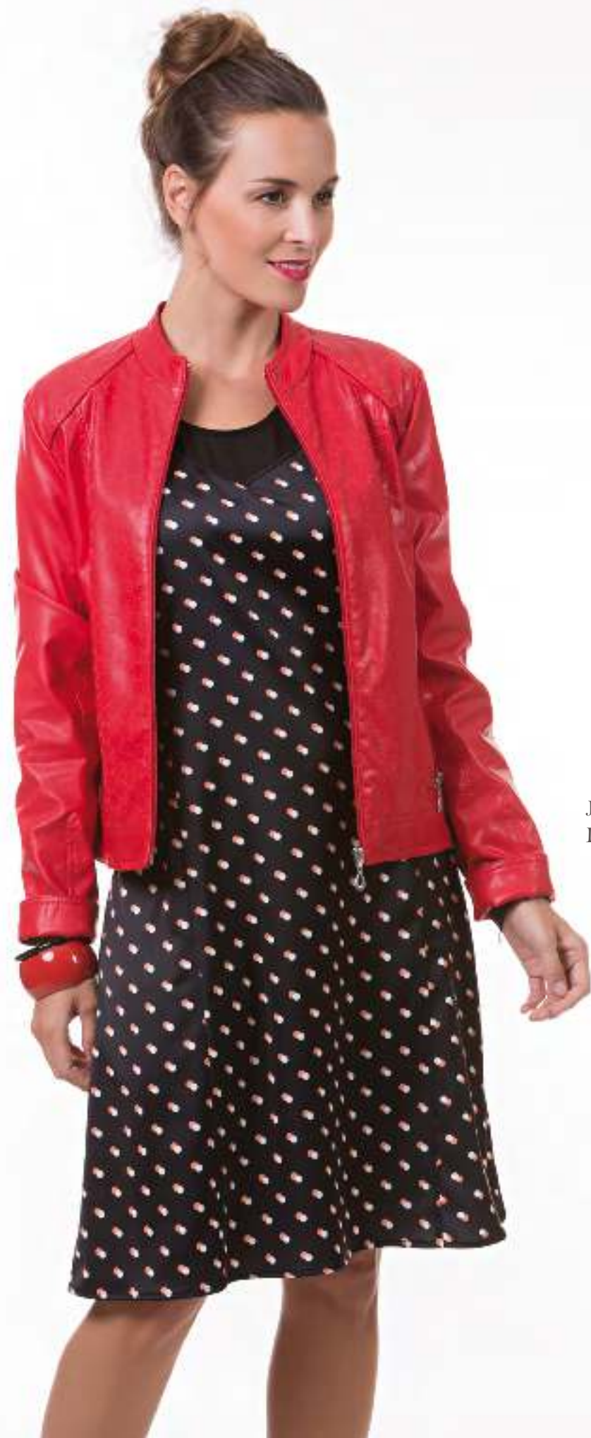
Jacket + Giveaway 140044 Dress 140607