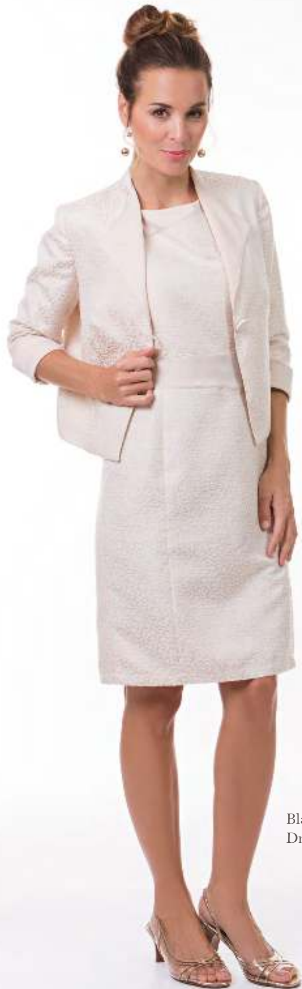
Blazer 140201 Dress 140610