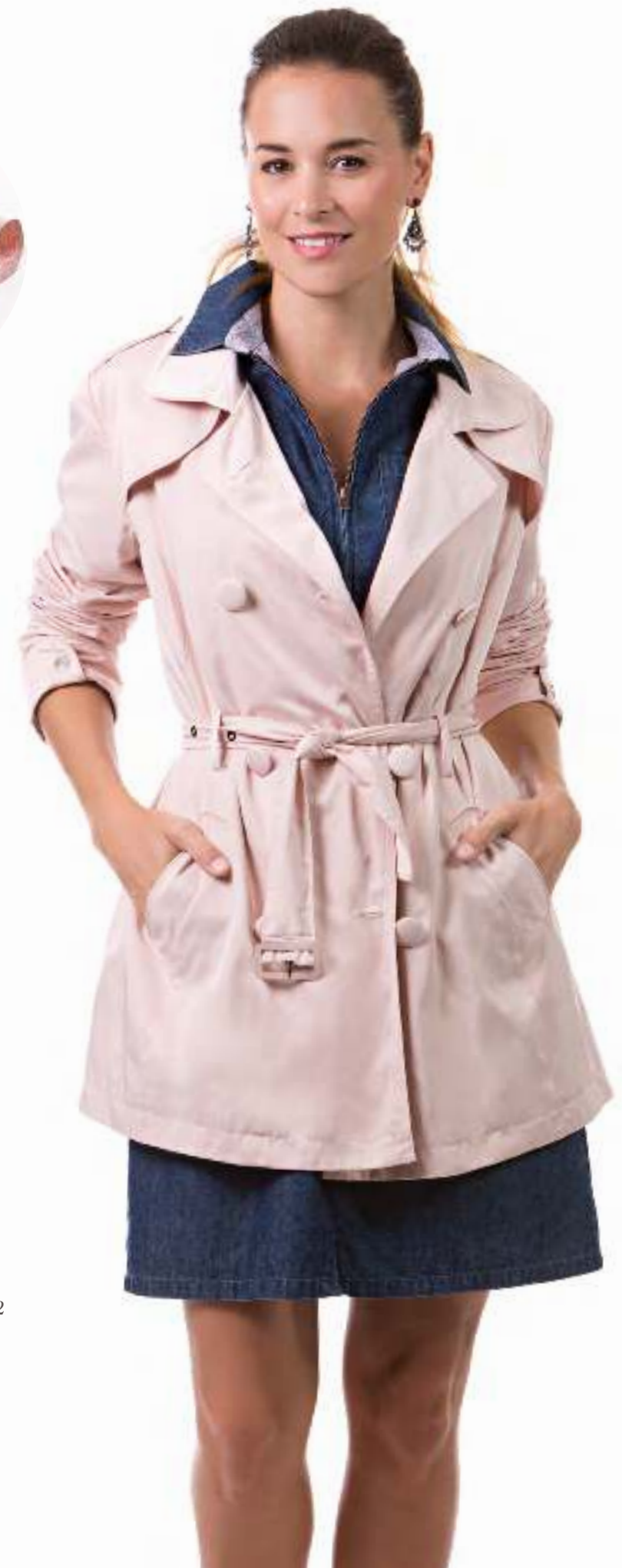
Trench + hat + giveaway 140062 Dress 140617