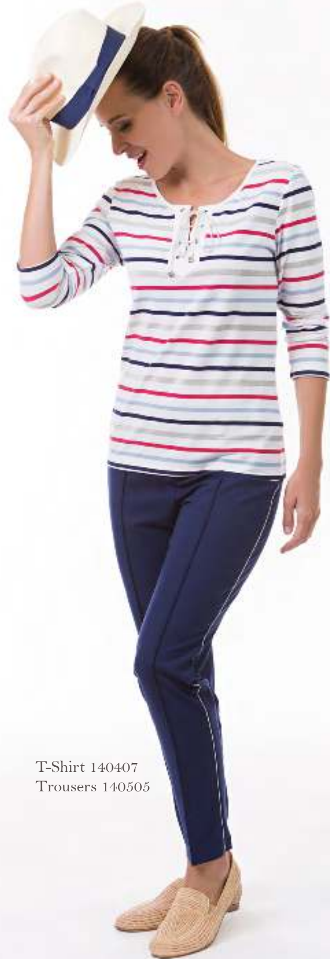
T-Shirt 140407 Trousers 140505