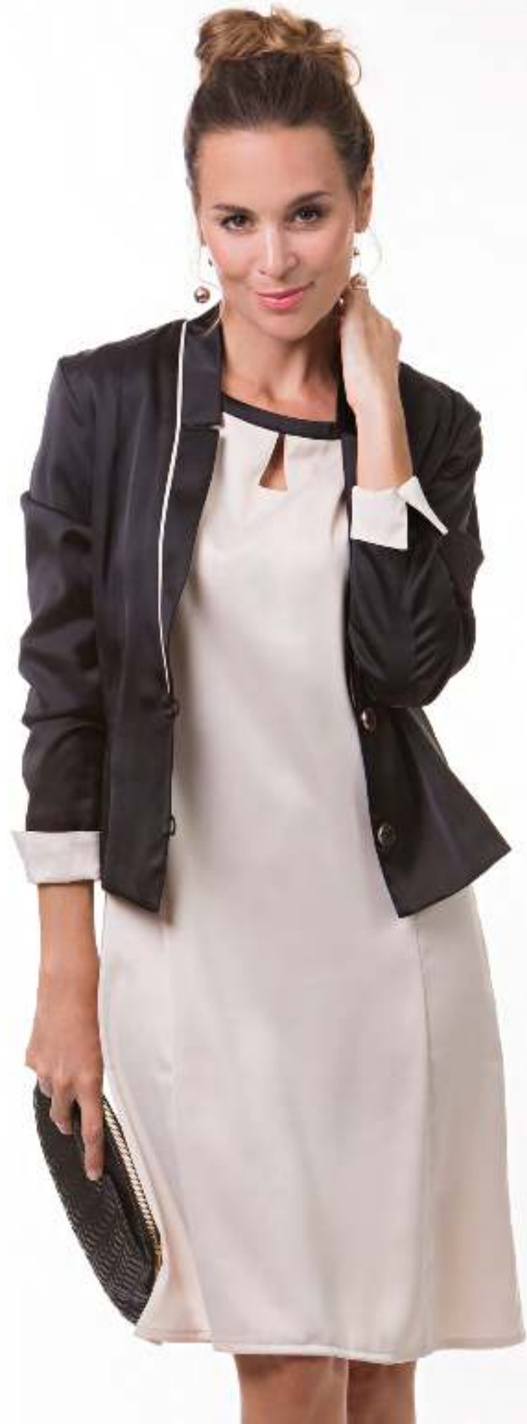
Blazer 140203 Dress 140606