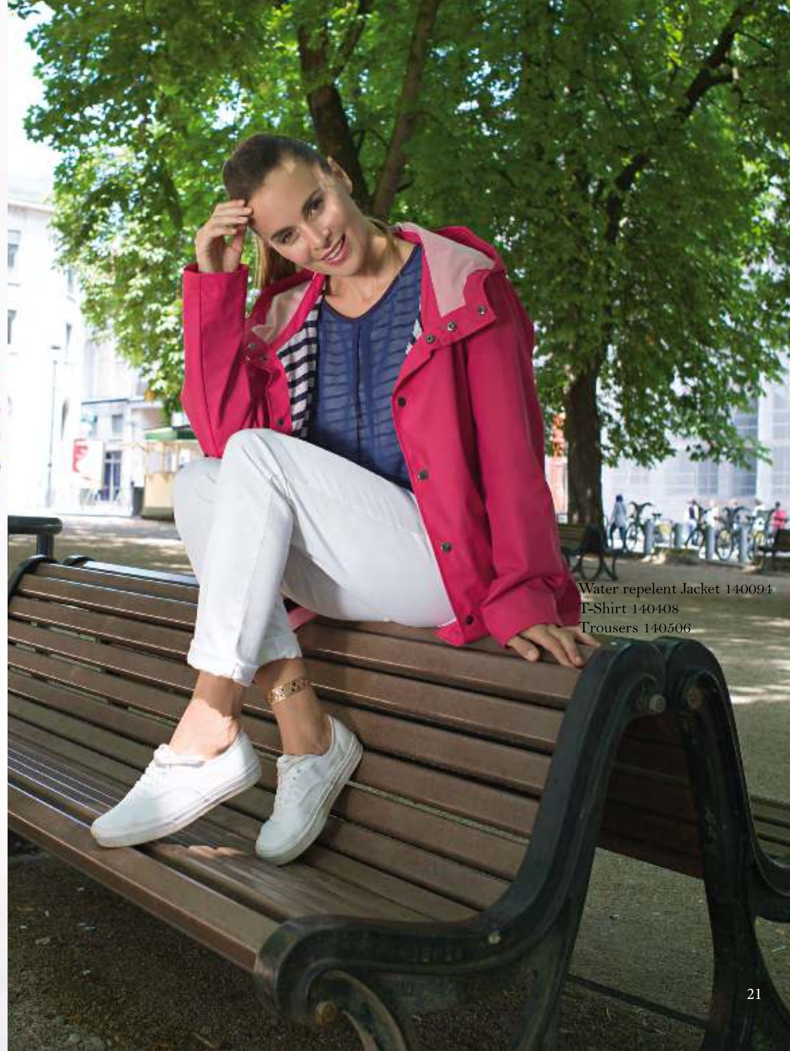
Water repellent Jacket 140094 T-Shirt 140408 Trousers 140506