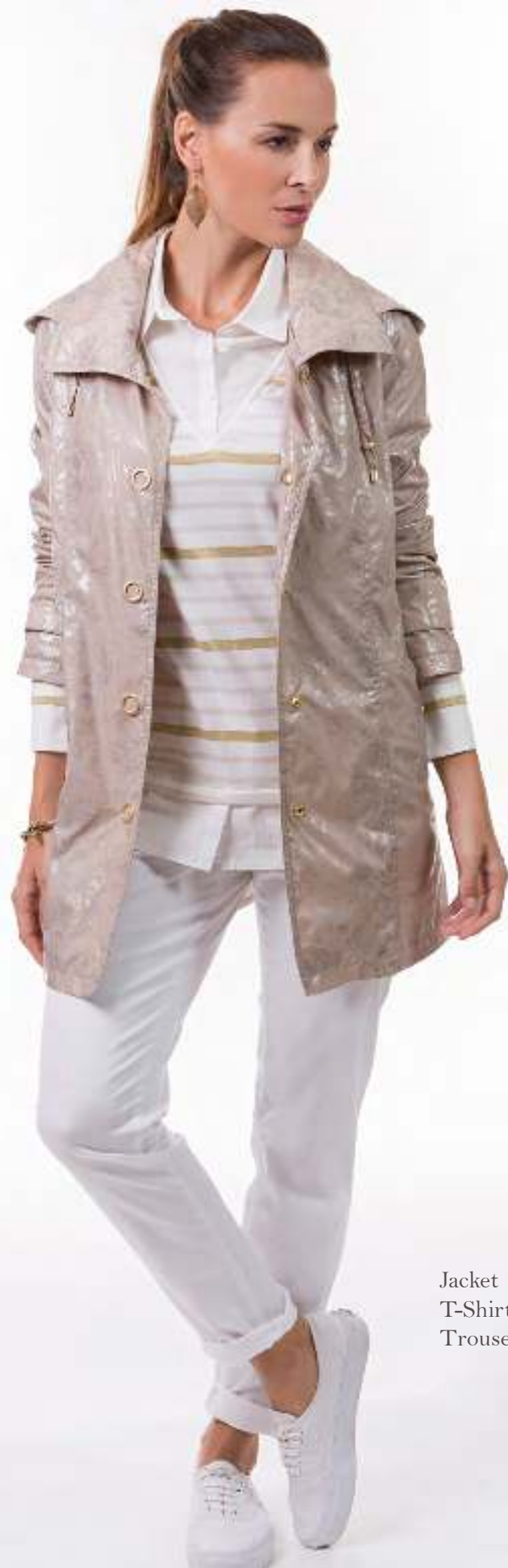
Jacket 140104 T-Shirt 140409 Trousers 140506