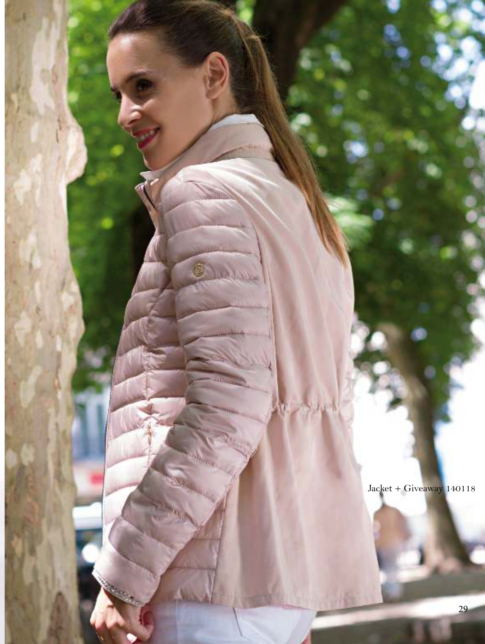
Jacket + Giveaway 140118