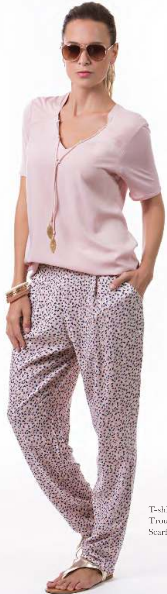
T-shirt 140416 Trousers 140509 Scarf 140703