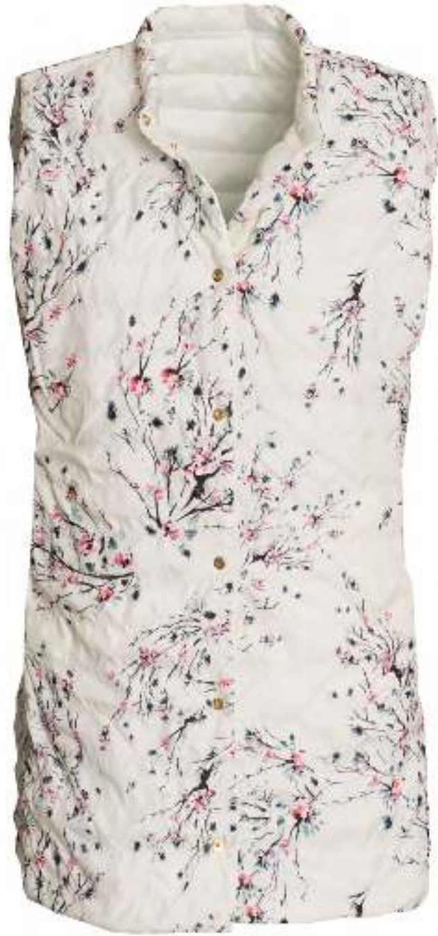
Long vest 140113