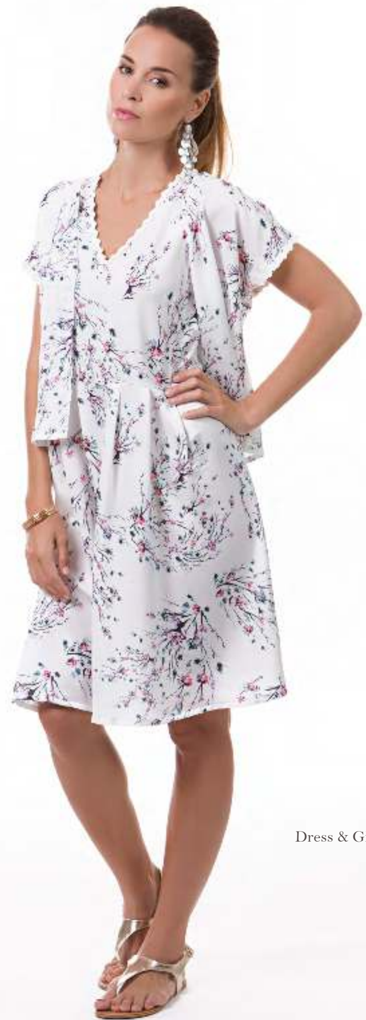
Dress & Gillet 140621