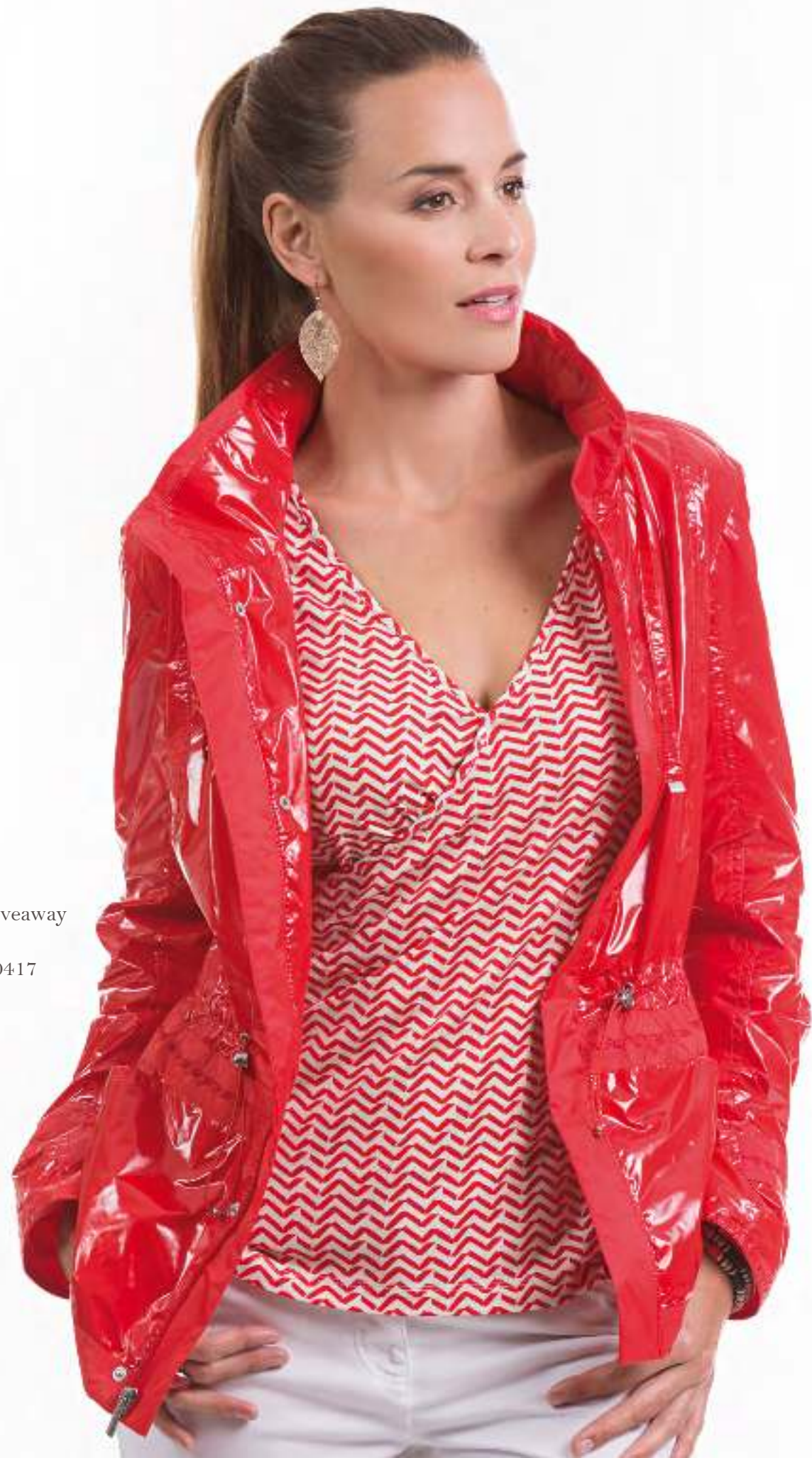
Jacket + Giveaway 140084 T-Shirt 140417