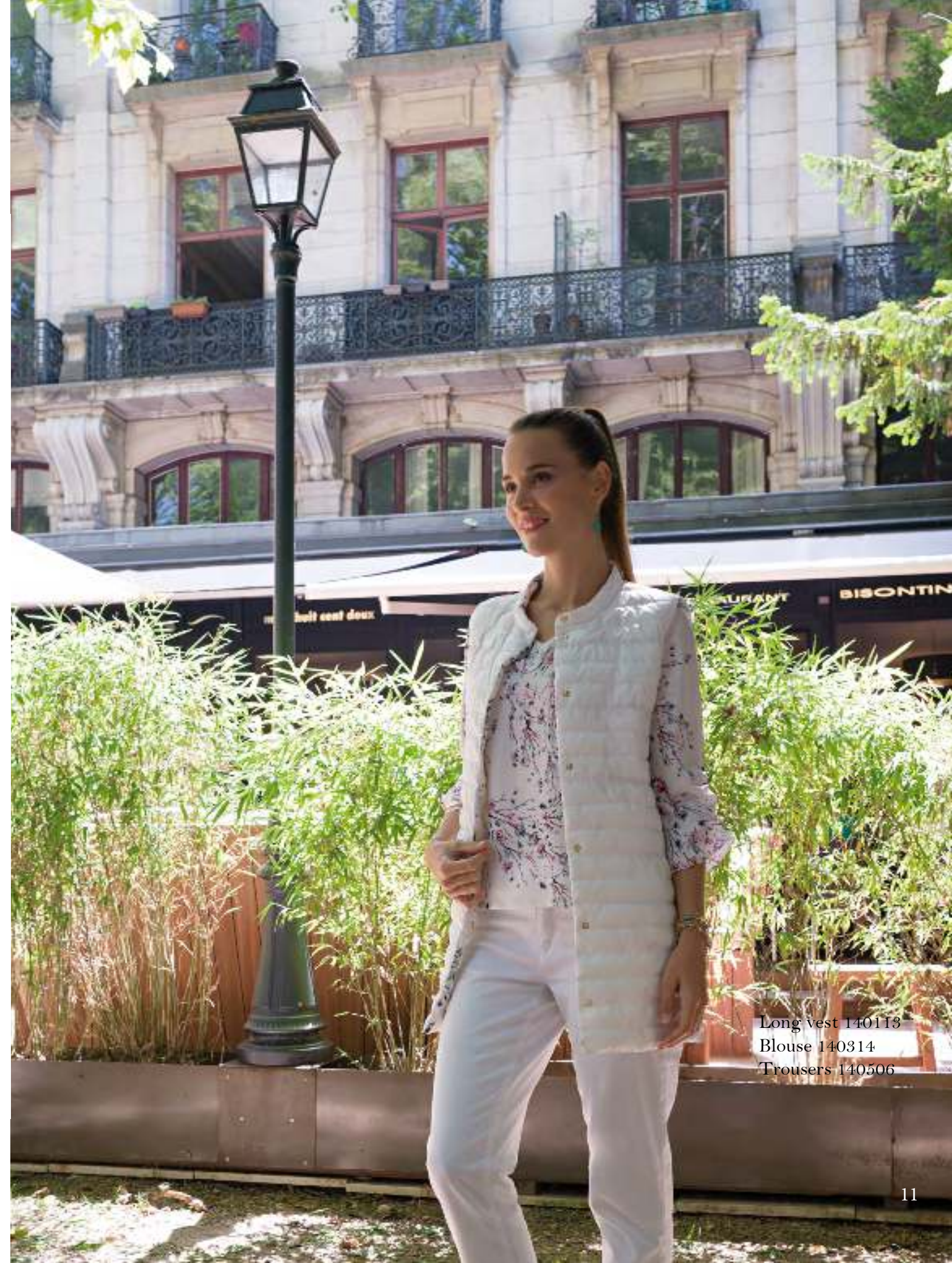
Long vest 140113 Blouse 140314 Trousers 140506