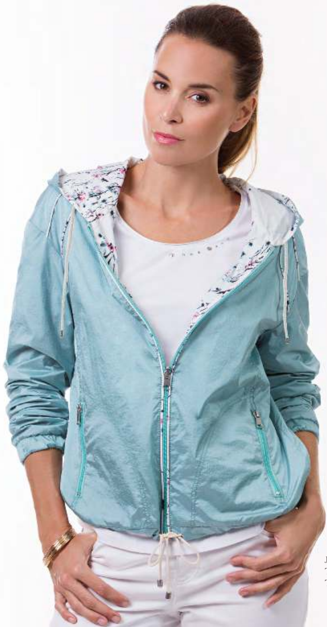
Jacket 140110 T-Shirt 140450 Trousers 140506