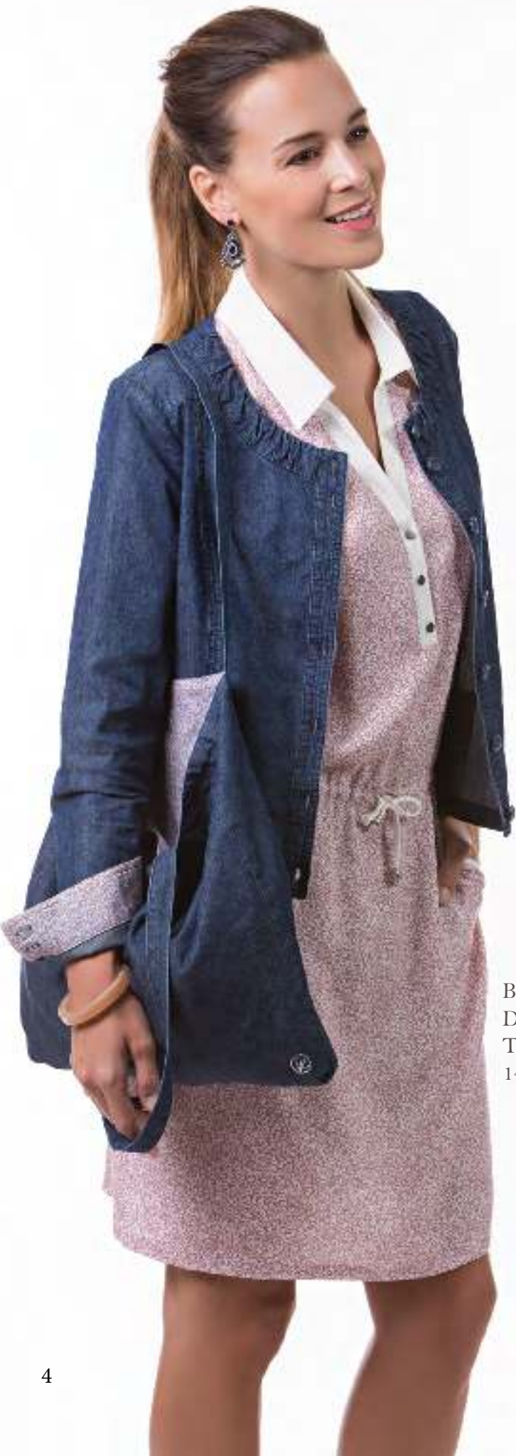
Blazer 140207 Dress 140615 Tote bag 140700