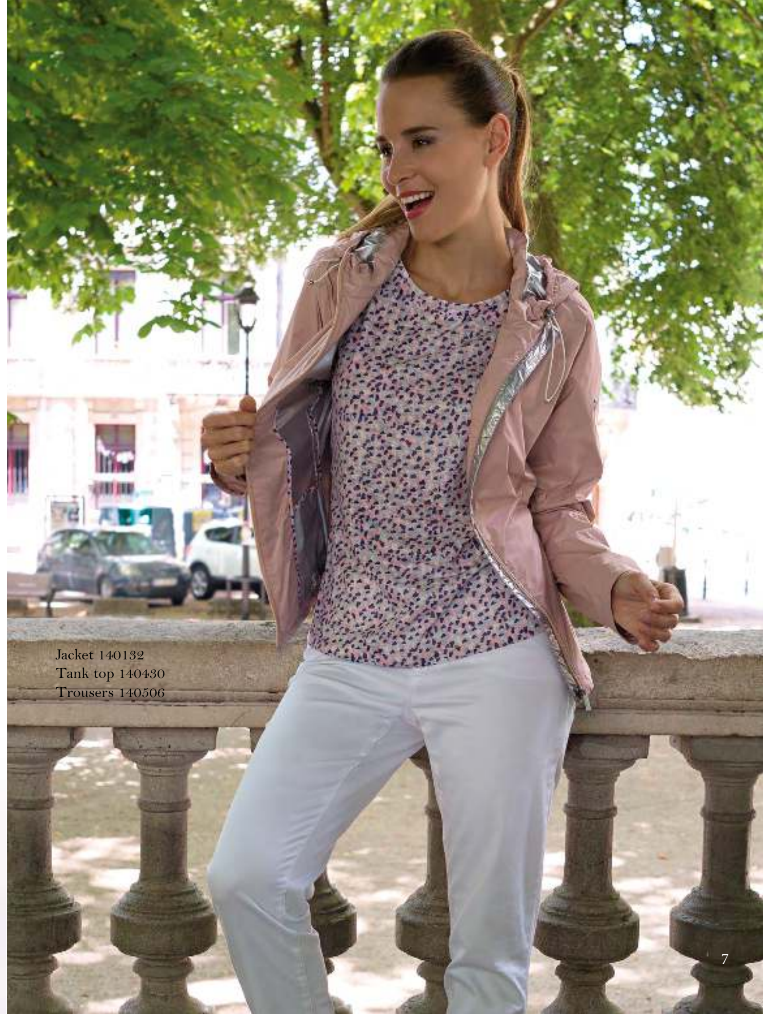
Jacket 140132 Tank top 140430 Trousers 140506