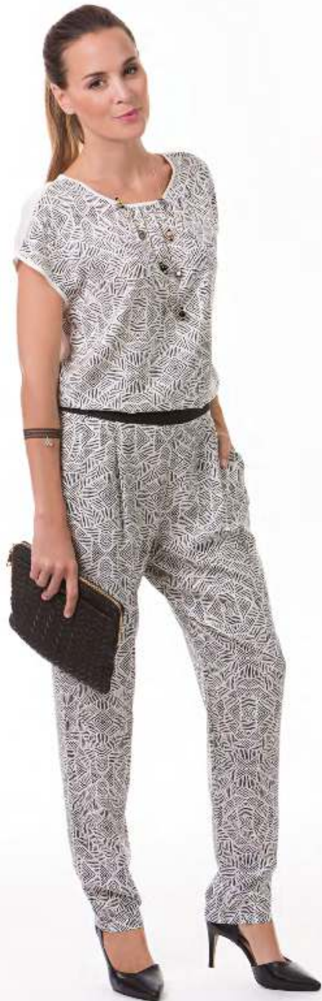
T-Shirt 140426 Trousers 140509