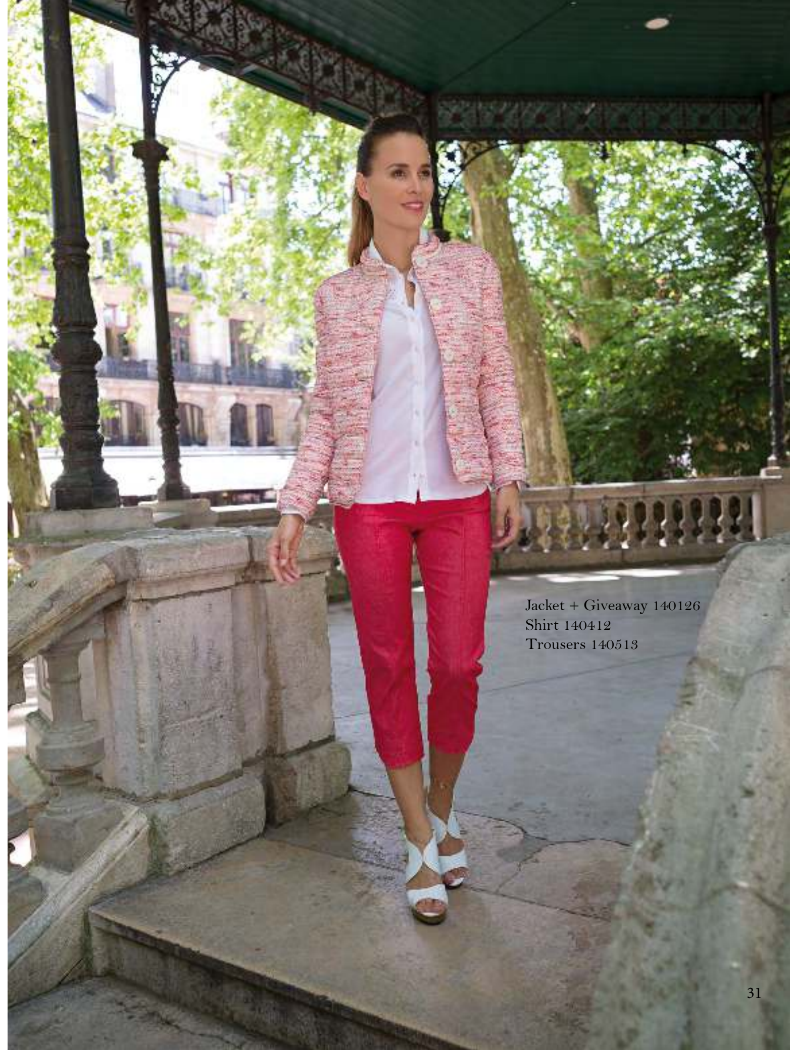
Jacket + Giveaway 140126 Shirt 140412 Trousers 140513